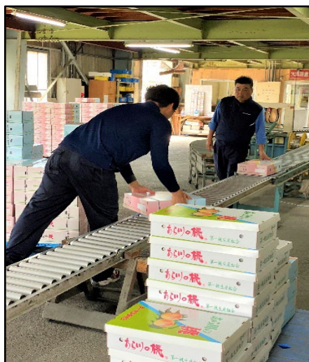
詰合せセット毎、選別作業状況