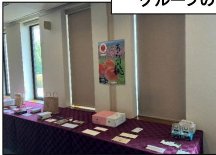
グループのイベント状況