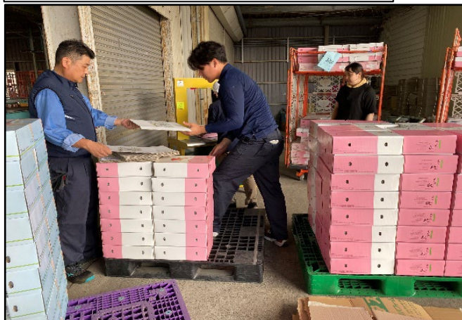
発送先毎、詰合せ箱ひも結束作業状況